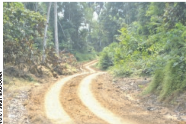
Les exploitants forestiers devraient tenir compte de l'impact environnemental.

Ces valeurs sont aussi économiques avec un potentiel de création de richesse, notamment touristique, culturelle dont le patrimoine socio-historique comme forêt sacrée. Elles sont enfin éducatives et sociales, avec un potentiel de développement d'actions pédagogiques et en faveur des populations locales.