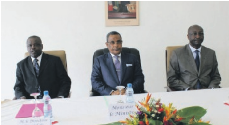
Le ministre Gabriel Tchango a honoré de sa présence l'ouverture du stage.