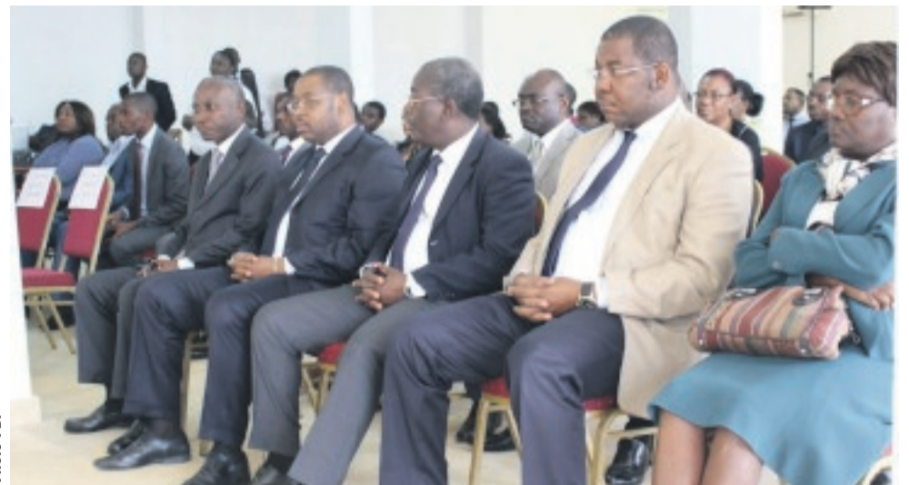
Une vue des participants ayant pris part à l'atelier.