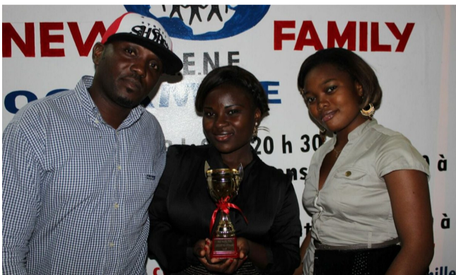
Les Voix du chœur primées meilleure chorale.