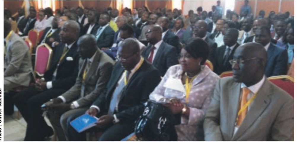
... face aux patrons d'entreprises, hier, à la Chambre de Commerce.

DETTE DE PLUS 3000 MILLIARDS. En effet, plus rien ne sera plus comme avant où, tant du côté des administrateurs des crédits que de celui des fournis-