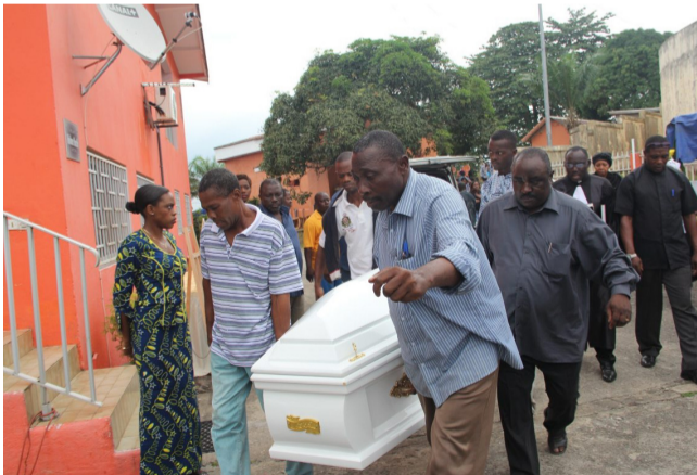
La bière avant sa mise en terre.