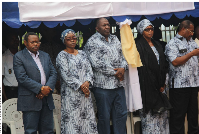
Les fils et proches de la disparue.