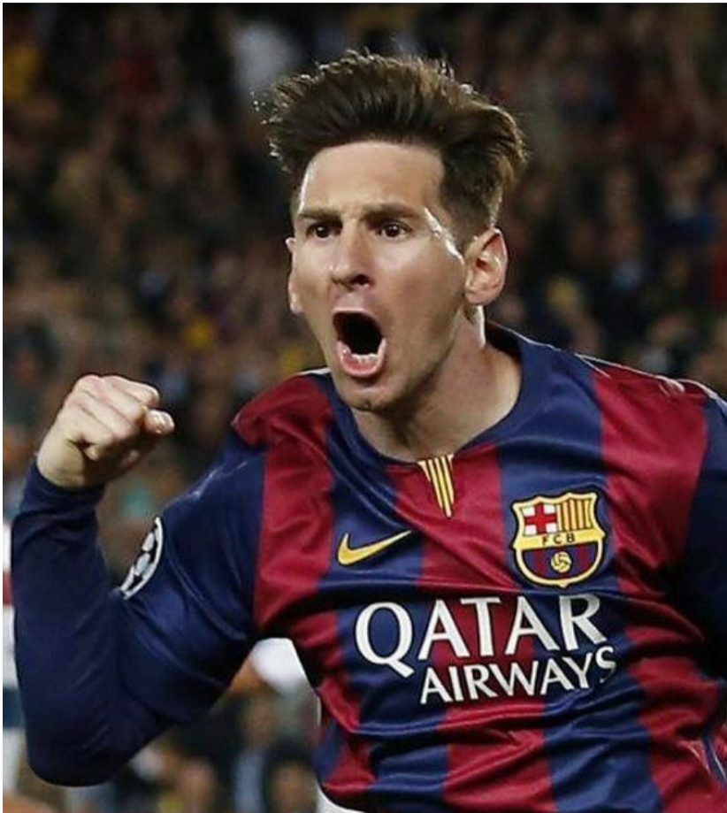
Lionel Messi lors d'une rencontre avec le Barca.

Lionel Messi, quadruple Ballon d'or, posera symboliquement, dès aujourd'hui, la première pierre du stade de Port-Gentil en compagnie du président de la République, Ali Bongo Ondimba. Avec cette nouvelle enceinte de 20 000 places, la capitale économique gabonaise pourra accueillir une partie des rencontres de la 31e édition de la CAN. Les autres sites de la compétition seront Oyem (un tout nouveau stade y est prévu), Franceville (qui a déjà abrité des matchs de la CAN-2012 et Libreville (dont les en-