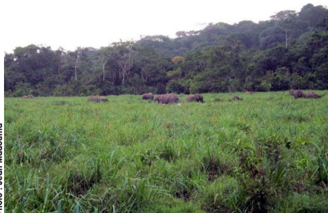
Une vue d'éléphants dans la baie au parc national de Mwagna.

de l'expert. En ce qui concerne le podium de notifications d'utilisation de la mallette, le Cameroun en compte 15. Le Gabon et le Congo 2, la RCA, le Burundi et la Guinée Equatoriale 1 notification. S'agissant du podium de notifications de conflits homme-faune, la RDC vient en tête avec 41, le Congo 32, le Gabon 16, le Cameroun 11, la RCA et la Guinée Equatoriale 4 et le Rwanda 2.