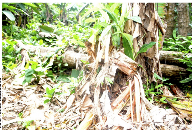
le conflit homme-faune est devenu récurrent. Ici une bananeraie sacagée par les éléphants.