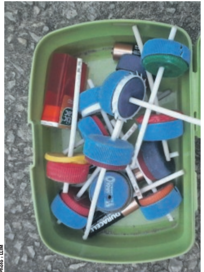
Vue d'une toupie telle que vendue dans les commerces.