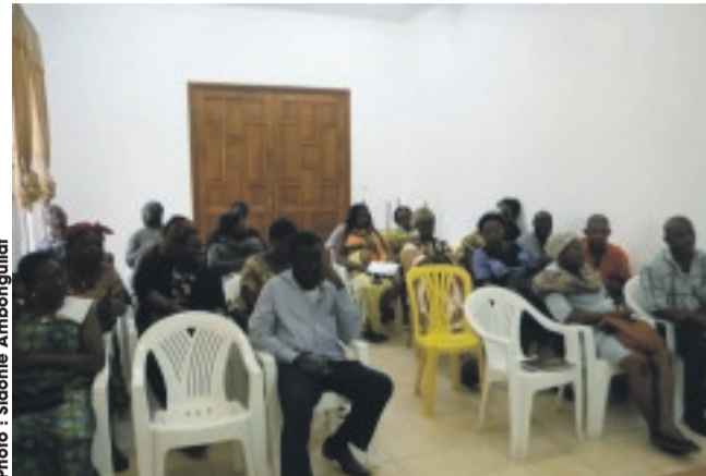
... les membres de l'association Service Plus.

activité économique qui consiste à acheter ou produire des biens ou des services en vue de les vendre pour en tirer un bénéfice, l'interlocuteur des acteurs associatifs a insisté sur l'objectif poursuivi par le gouvernement gabo-