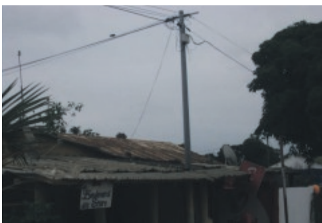
Des poteaux électriques à l'intérieur de certaines habitations.

IL n'est pas rare de constater dans notre cité que les règles d'urbanisme sont impunément foulées aux pieds par nombre de citoyens dont les constructions ne tiennent nullement compte des principes de base régissant le domaine public pour une urbanisation respectée. A vue d'œil, on constate des constructions qui fleurissent ici et là, gé-