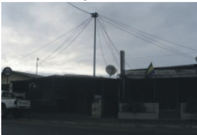
Ces fils qui pendent partout : un danger pour les habitants et les piétons.

sur le bon sens. Il va sans dire que vivre en ville recommande des attitudes dignes des citoyens.