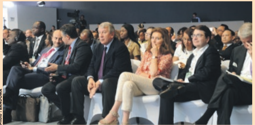
une vue des invités de la 3e édition du NYFA en 2014.