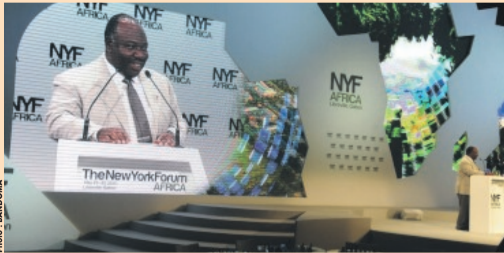
Le président Ali Bongo Ondimba donnera, ce matin, le coup d'envoi de la 4e édition du NYFA.