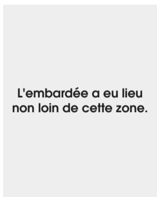
L'embardée a eu lieu non loin de cette zone.

UNE voiture de marque Mitsubishi Pajero, immatriculée DK-115-AA, a effectué une embardée, le dimanche 30 août dernier, vers 13 heures, dans les environs de Four-Place, un village du département du Komo-Kango. Bilan : quatre blessés graves, qui ont été évacués du côté