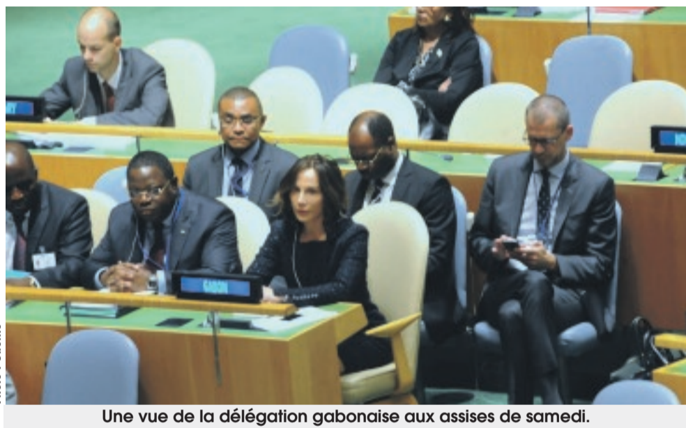
Une vue de la délégation gabonaise aux assises de samedi.