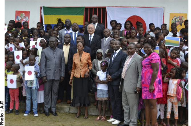
Photo de famille entre les donateurs, le corps enseignant, les élèves et diverses autres personnalités.