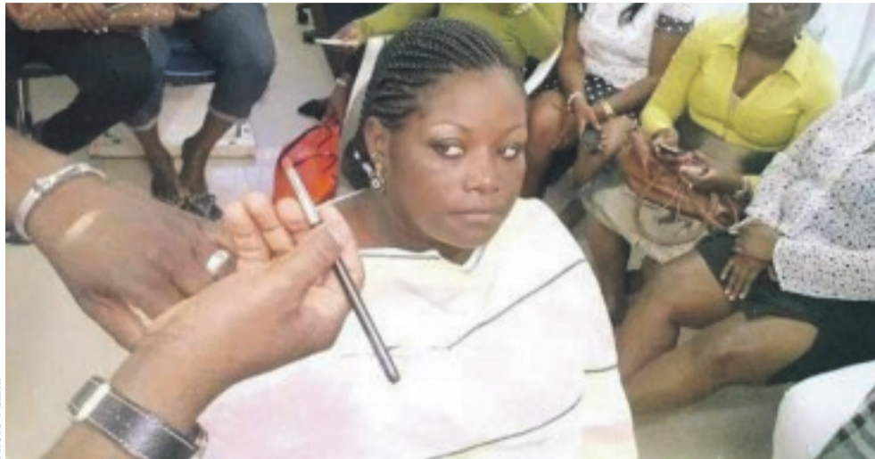
Les membres de l'association "Rondes et jolies" pendant un coaching de maquillage.