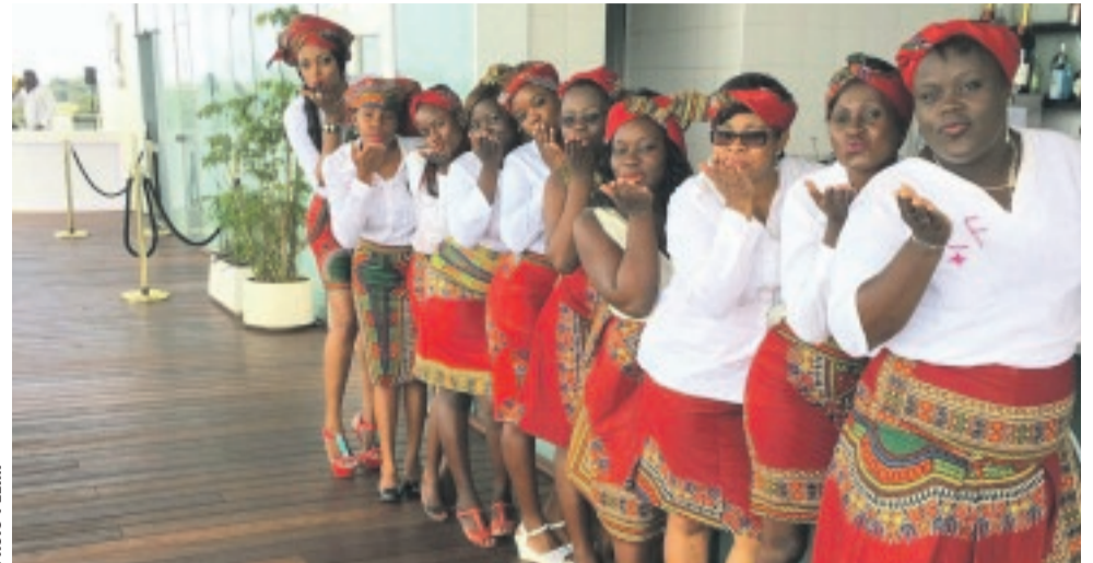
Quelques membres de "Femmes chics et fabuleuses" (FCF).