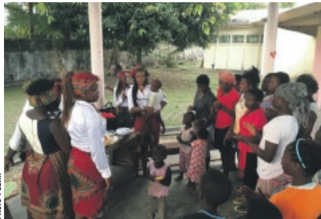
Les adhérentes de FCF soufflant la bougie de leur premier anniversaire avec les pensionnaires du centre social d'Agondjé.