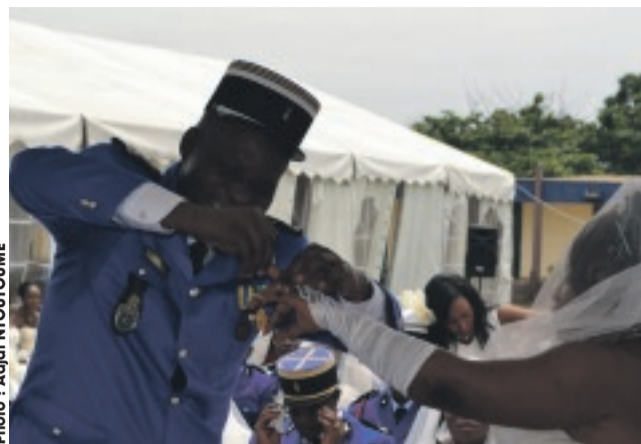
La séquence de l'anneau pour un couple.

VINGT couples ont décidé de rompre avec le célibat, de joindre leurs vies et de vivre