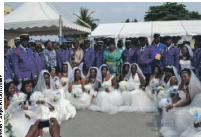
Les nouveaux mariés pour une photo de famille.

ensemble, pour le meilleur et pour le pire, jusqu'à ce