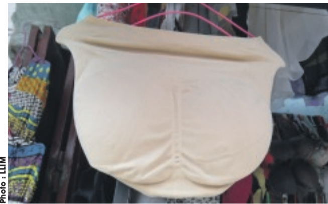
Ce petit accessoire de beauté féminine semble boudé par les hommes.

Même s'il y en a qui se aime "Bio", selon une expression empruntée à l'alimentation, qui nomme ainsi tout ce qui est cultivé sans engrais chimiques, et qui voudrait que les mâles apprécient les femmes naturelles.