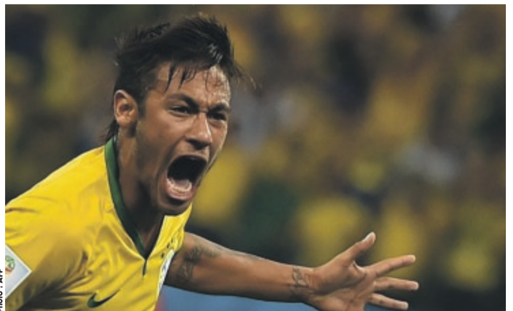
Neymar rêve d'offrir au Brésil le seul titre manquant à son palmarès.

L'attaquant du FC Barcelone rêve d'offrir un pre-