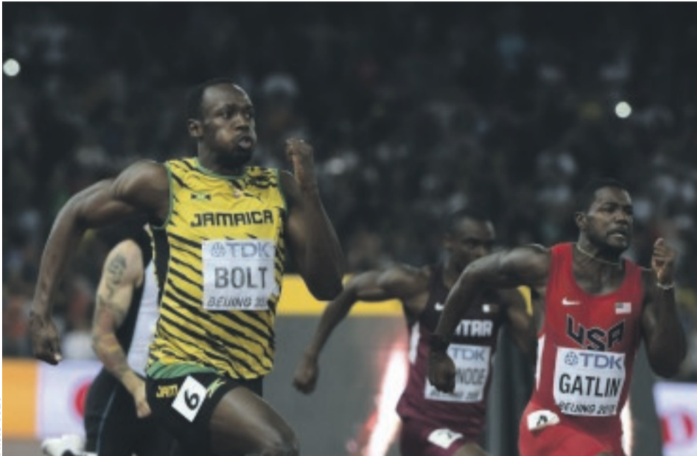
Le Jamaïcain Usain Bolt est l'un des stars attendues aux J.O 2016 à Rio.