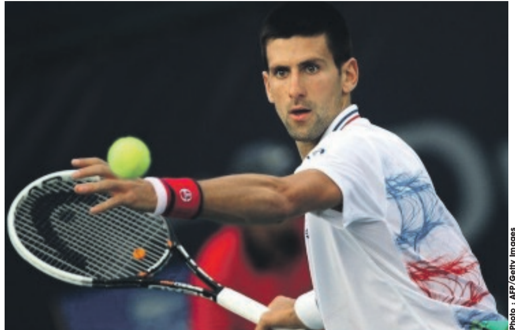
Novak Djokovic sera le favori logique pour l'or olympique.