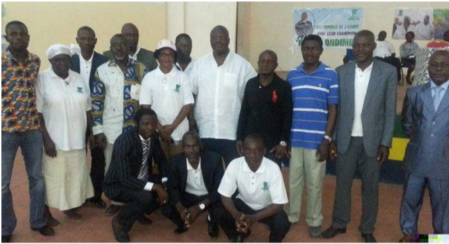
Photo de famille du président de l'Adere et des membres des structures de base installés