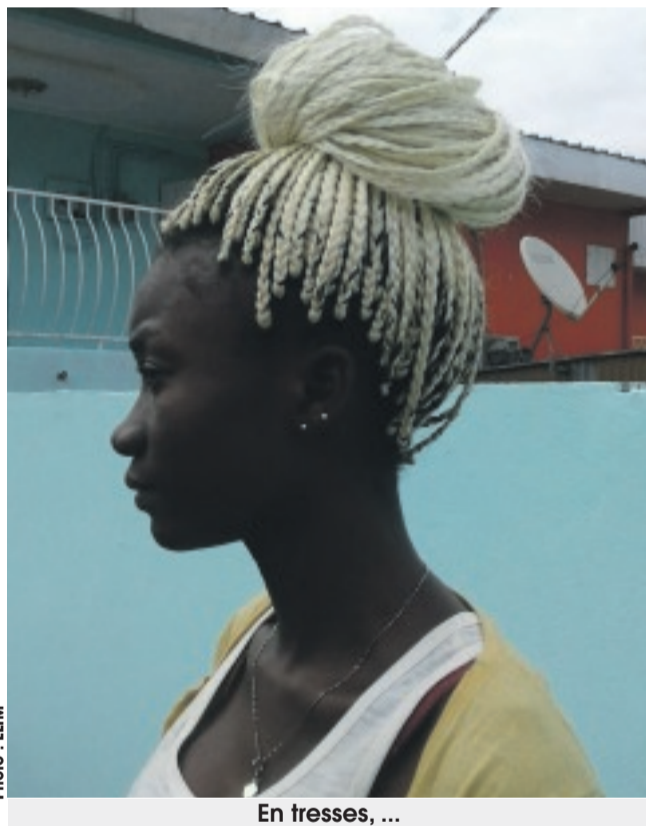
En tresses, ...