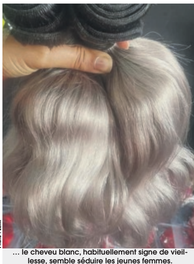
... le cheveu blanc, habituellement signe de vieillesse, semble séduire les jeunes femmes.

« De toute façon, les cheveux gris sur une