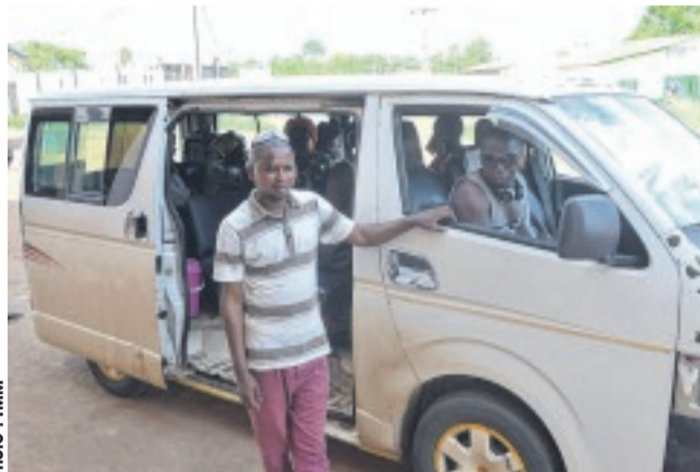
Un acteur du transport interurbain, domaine intéressant le nouveau syndicat.

« Par le biais de notre syndicat, nous voulons non seulement défendre les intérêts des transporteurs, mais surtout innover pour changer de paradigmes dans le secteur du transport urbain et interurbain », ambitionnent les