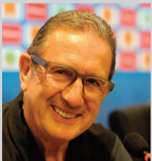
Georges Leekens, sélectionneur de l'Algérie:

« On devait jouer pour notre honneur, je suis fier de la performance, on sort avec la tête haute. Cette expérience est très importante pour l'avenir, on doit jouer comme ce dernier match même si au final c'est une déception. Je suis sûr de moi, on a du boulot à faire, mes joueurs ont montré qu'il savent réagir. »