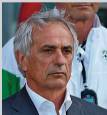
Vahid Halilhodzic sélectionneur du Japon :

" La CAN est une compétition très étrange. En 2010, l'Algérie a passé le 1er tour avec 1 seul but marqué et 3 encaissés. Moi, j'ai rarement vu une équipe marquer autant dans une phase finale et ne pas se qualifier. Mais avec le niveau affiché, l'élimination était logique."