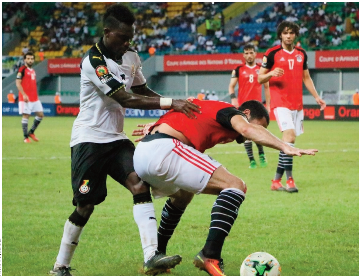
Egyptiens et Ghanéens au-dessus du lot.

D'un côté le Mali est opposé au Ghana et de l'autre, l'Égypte à l'Ouganda. À l'arrivée, ce sont les Black Stars et les Pharaons qui réalisent la bonne opération en battant leurs adversaires (1-0). Le Ghana (6 points) et l'Égypte (4 points) sont, à cet instant, les qualifiés du groupe. Sans être mathématiquement hors de course, le Mali se trouve néanmoins dans une situation compliquée pour prétendre à une place en quarts. L'Ouganda étant définitivement écarté après sa deuxième défaite.