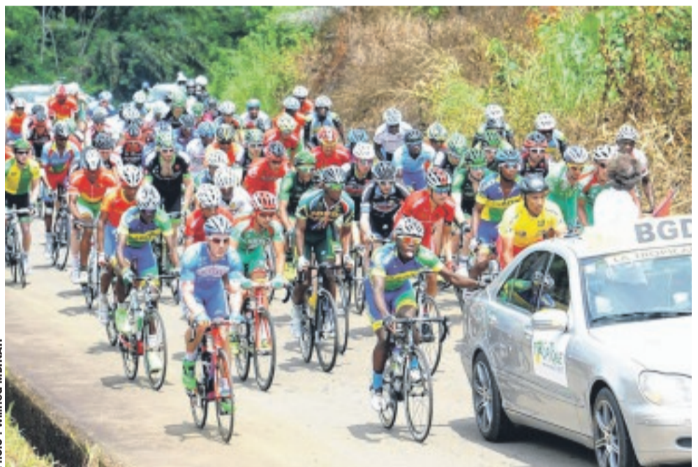
Le départ de la Tropicale sera donné le 27 février prochain.

viaire, santé, promotion-animation, relation ville-étape et communication) s'est ajoutée, cette année, la commission "compétitions", essentiellement composée des membres de la Fédération gabonaise de cyclisme. Notons, à titre de rappel, que la 12e édition de la Tropicale Amissa Bongo aura lieu du 27 au 5 mars 2017. Elle va se courir en 10 étapes sur les routes des provinces du Haut-Ogooué, de l'Ogooué-Lolo, du Moyen-Ogooué, de la Ngounié et de l'Estuaire. Quinze équipes seront en compétition, soit cinq professionnelles et dix sélections nationales africaines.