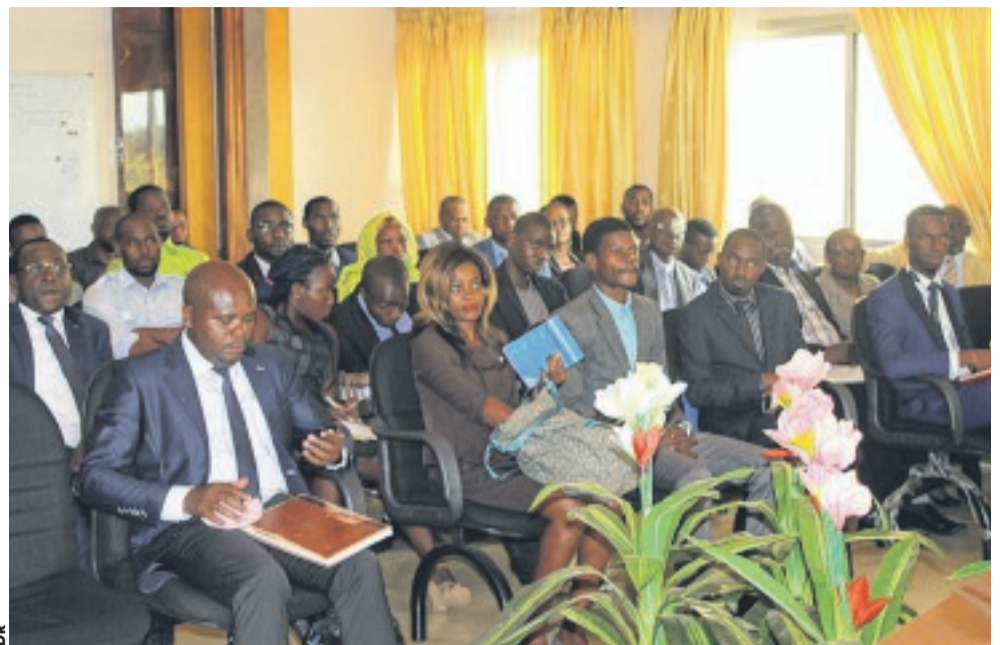
Les responsables des commissions