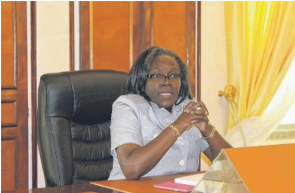
La ministre des Sports, Nicole Assélé