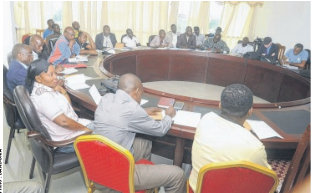
...aux journalistes sportifs gabonais.