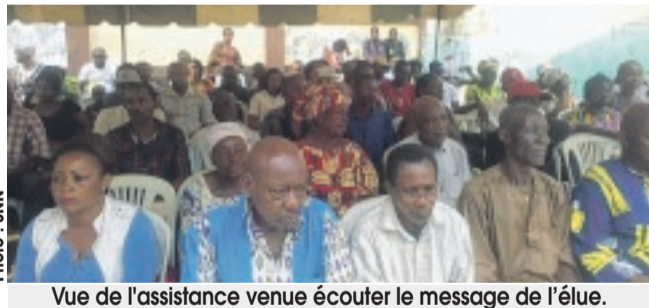
Vue de l'assistance venue écouter le message de l'élue.

la suppléante du ministre Eloi Nzondo (CLR) a indiqué que sa participation aux travaux de l'institution à laquelle elle appartient s'est faite lors de la deuxième session. Au total elle a participé au vote de quatorze lois. Il s'agit, entre autres, des lois relatives au Code de l'aviation civile, à la réglementation de l'agent immobilier en République gabonaise, au Code de protection sociale, etc. La parlementaire a expliqué que ces textes votés permettront au président de la République, Ali Bongo Ondimba, de prendre des décisions qui concourent au bien-être des populations. Mme Kotha a promis aux siens qu'elle ne ménagera aucun effort "pour être à (leur) écoute et