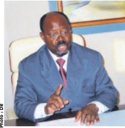
Paul Mba Abessole, président du Rassemblement pour le Gabon (RPG).

leurs candidat malheureux à la dernière Présidentielle. C'est dire, a-t-il conclu, qu'à partir de la situation actuelle, "tous devraient progressivement évoluer vers une entente pour un dialogue unique et commun". Rappelons que l'ancien curé avait aussi pris part au dialogue organisé, en décembre dernier, par Jean Ping.