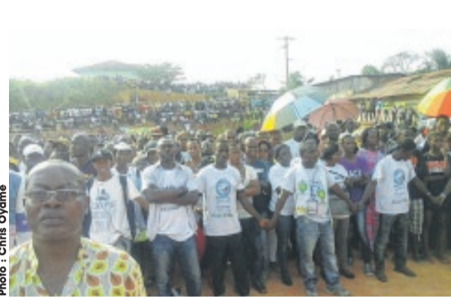
Une vue de l'assistance lors du meeting.