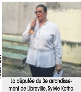
La députée du 3e arrondissement de Libreville, Sylvie Kotha.