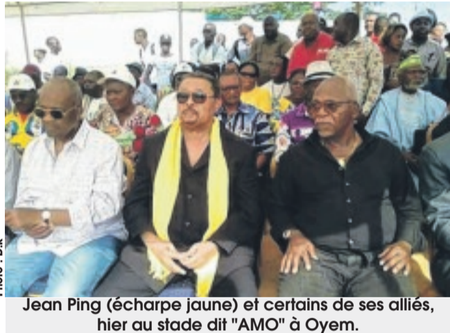
Jean Ping (écharpe jaune) et certains de ses alliés, hier au stade dit "AMO" à Oyem.

LA Coalition pour la nouvelle République, dirigée par Jean Ping effectue, depuis hier, une tournée interprovinciale, à Oyem, dans la province du Woleu-Ntem. Cette étape aura été marquée par une manifestation qui a vu la présence d'une assistance nombreuse. Au