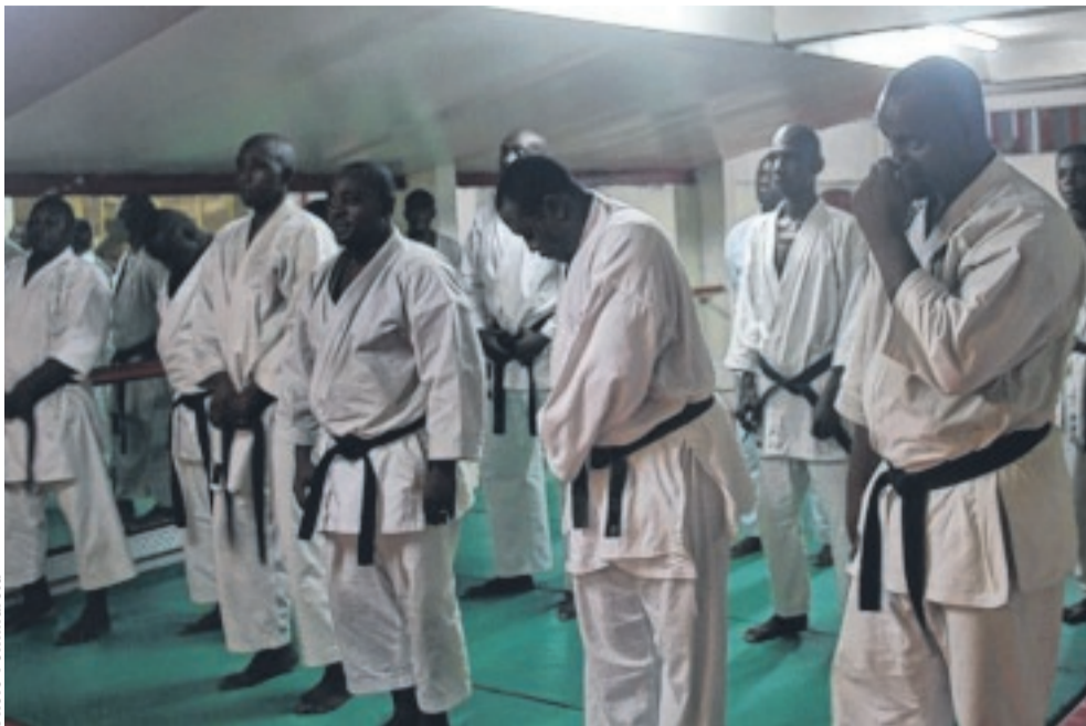
Quelques maîtres pendant le stage...