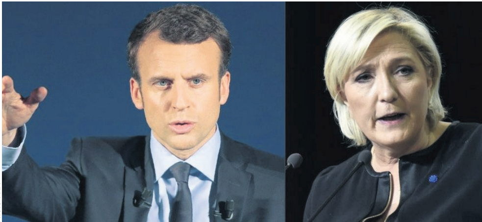
Emmanuel Macron a joué hier sur le terrain de la mémoire pendant que sa rivale Marine Le Pen draguait les électeurs de "la France insoumise" de Jean-Luc Mélenchon.