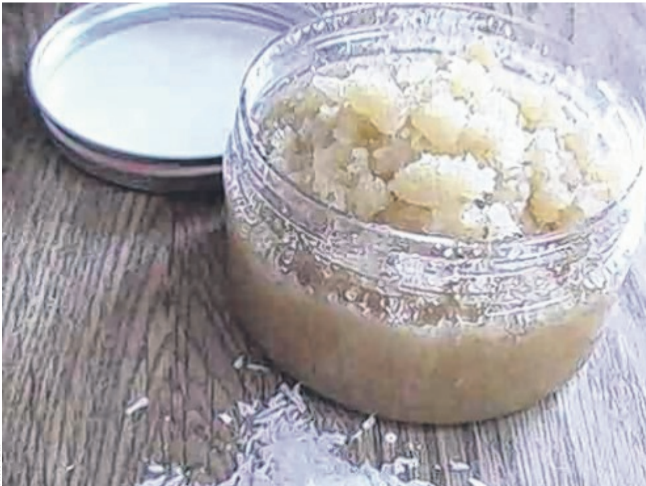
Essayez le gommage au sucre pour requinquer votre peau.