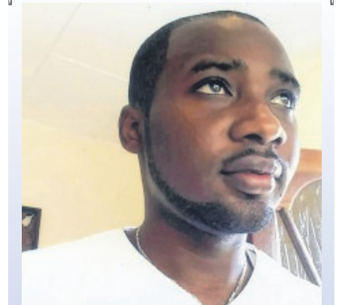
HAPPY BIRTHDAY MON BOUBOU!!!