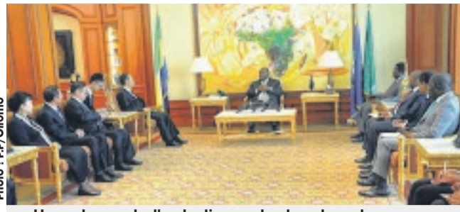
Une phase de l'entretien entre les deux hommes.

derniers événements post-électorales. La Chine et le Gabon entretiennent des liens diplomatiques vieux d'une quarantaine d'années, depuis les défunts présidents Omar Bongo Ondimba, et Mao Tsé Toung. Depuis lors, la deuxième puissance économique mondiale est assez présente dans certains pans