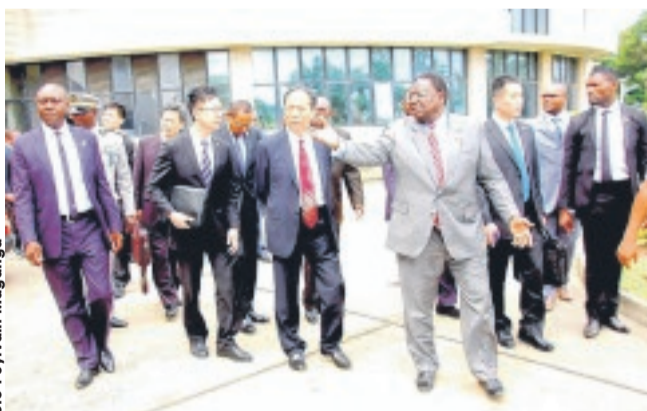
Visite des décombres de la maison du peuple par les deux délégations.