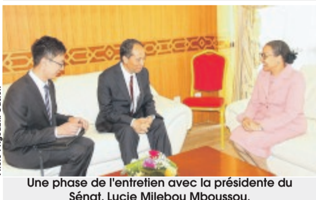
Une phase de l'entretien avec la présidente du Sénat, Lucie Milebou Mboussou.