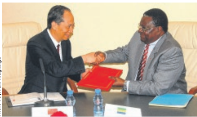
La coopération parlementaire désormais magnifiée.

C'est ce qui ressort de la séance de travail, hier, à l'Assemblée nationale, entre le bureau de cette institution présidée par Richard Auguste Onouvié, et la délégation chinoise conduite par le Premier vice-président du Comité permanent de l'Assemblée populaire nationale de Chine, Ji Binxuan. Il s'agit d'une réponse favorable à une doléance formulée, en décembre dernier, par le chef de l'Etat, Ali Bongo Ondimba, lors de son dernier déplacement en terre chinoise. L'autorité chinoise s'est également entretenue avec la présidente du Sénat, Lucie Milebou Mboussou.