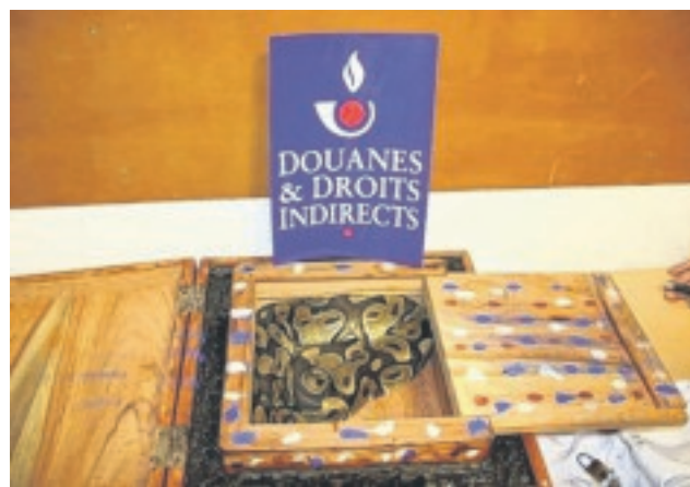
Le serpent vivant était dissimulé dans une caisse en bois soigneusement fermée.

générale des Douanes de l'aéroport de Paris Roissy Charles-de-Gaulle. Le python est protégé par la convention de Washington, rappelle la douane française sur son site. Ce qui implique de fortes restrictions pour avoir le droit de posséder ou de transporter un tel animal. « C'est une espèce protégée dont le commerce est réglementé », ajoute la secrétaire générale des douanes. Un permis spécial est nécessaire à son transport. « On pensait au moins avoir un serpent mort mais celui là était bien vivant. » Le reptile a été confié à une animalerie après un contrôle vétérinaire tandis que son propriétaire indé-