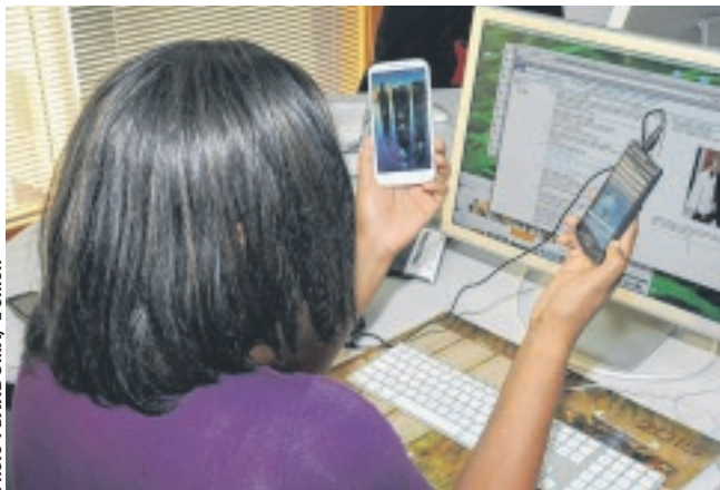
Le téléchargement au Gabon a encore du chemin.

minutes pour télécharger une vidéo HD de 7,5Go. Au niveau mondial, sur les 189 pays évalués, Singapour est le pays qui détient la meilleure fluidité. Il trône au classement avec des vitesses de téléchargement atteignant 55.13Mbps. Dans ce pays, il faut compter 18 minutes et 30 secondes, pour télécharger une vidéo HD de 7,5Go. Le dernier pays à ce classe-