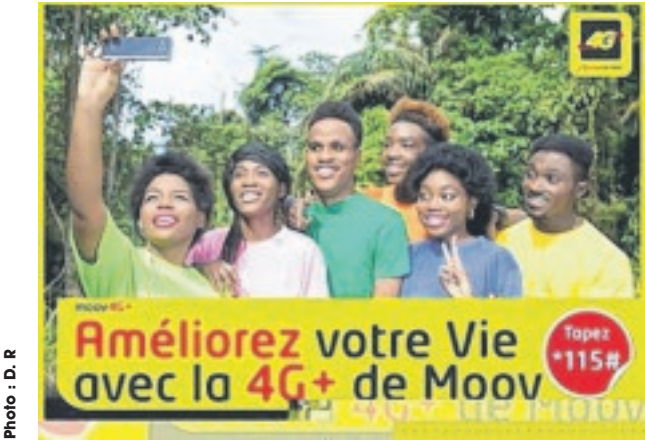
Une publicité en déphasage avec la réalité?

ALORS que les opérateurs de téléphonie mobile, notamment Gabon Telecom, vante à longueur de journée les capacités techniques exceptionnelles de la 4G du Gabon, en terme de vitesse de téléchargement, une étude internationale vient d'apporter la preuve du contraire de cette affirmation. D'après les résultats d'une enquête de Measurement Lab (M-Lab) compilés par Cable.co.uk, le Gabon se classe au 35erang africain et au 188e rang mondial, sur les 189 pays examinés, en ce qui concerne la qualité de la vitesse de téléchargement. Pour télécharger une vidéo HD de 7,50Go au Gabon, il faut une journée et près de 18 heures, soit un débit affiché de 0.41 Mbps.