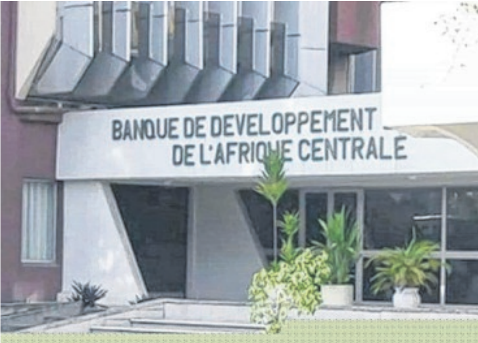
Les entreprises gabonaises gagneraient à solliciter le concours de la BDEAC pour le financement de leurs activités.

LA Banque de développement des Etats de l'Afrique centrale (BDEAC), en partenariat avec la Société générale des banques du Cameroun SA (SGBC), la Banque internationale du Cameroun pour l'épargne et le crédit (BICEC), ont récemment signé, à Brazzaville, au Congo, siège de l'institution, une convention de financement avec la Société camerounaise de transformation de blé (SCTB). Ce prêt, d'un montant de 9 milliards 960 millions de francs, est destiné à couvrir les travaux de construction et d'acquisition d'une ligne de transformation du blé par la SCTB SA. Selon la banque sous-régionale, il s'agit d'une concentration verticale des activités de l'emprunteur qui intervient déjà dans la