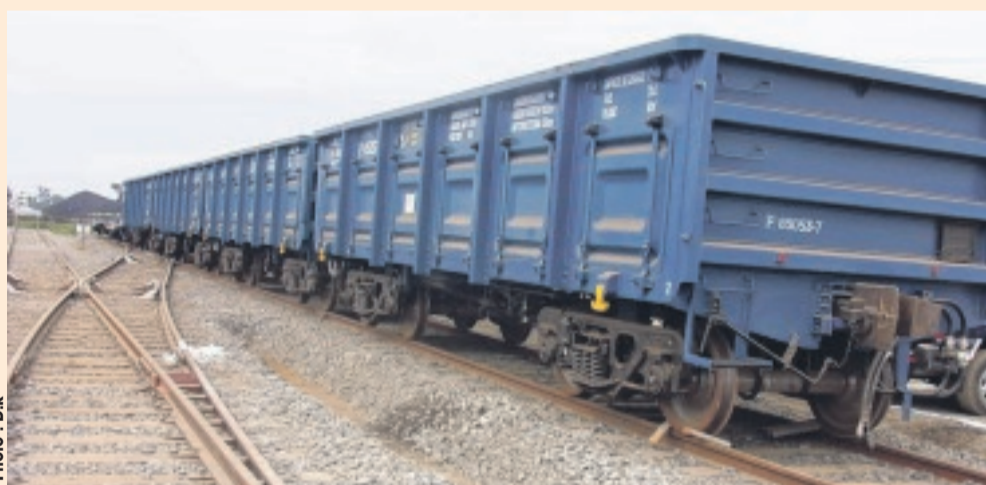
Une vue du port minéralier d'Owendo appartenant au groupe Olam international.

nariat qui lie le Gabon au groupe Olam international. « Ce type de partenariat - archétypique - doit d'ailleurs nous servir de modèle dans bien d'autres domaines. D'autant que les retombées que nous attendons sont importantes sur le plan économique. En matière d'emplois, plus de 300 emplois directs, pérennes, et un millier d'emplois indirects seront créés. En termes de pouvoir d'achat, le nouveau port d'Owendo est un instrument de lutte contre la vie chère. Un outil qui va accélérer les échanges et permettre une économie de plusieurs milliards de francs par an, qui devra être répercutée, in fine, sur