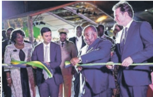
Le président Ali Bongo Ondimba procédant à la coupure du ruban symbolique lors de l'inauguration du nouveau port international d'Owendo.

ambitions : lutter contre la vie chère en multipliant par deux la capacité portuaire de la capitale, et en abaissant de 25 % les coûts de passage ; mais aussi faire de Libreville une escale commerciale majeure sur l'Atlantique, et permettre à l'économie gabonaise de gagner en compétitivité et en attractivité. «Voici un instrument de lutte contre la vie chère. Un outil qui va accélérer les échanges, et permettre une économie de plusieurs milliards de francs CFA par an qui devra être répercutée, in fine, sur les prix proposés aux consommateurs. L'impact sera donc immédiat pour les Gabonaises et les Gabonais. Nous y veillerons