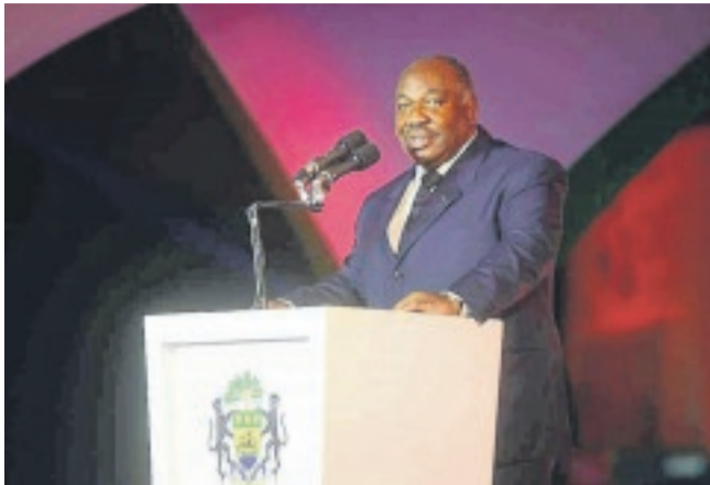
Le chef de l'Etat lors de son allocution.

LE président de la République, Ali Bongo Ondimba, a procédé le samedi 14 octobre à l'inauguration du nouveau port international d'Owendo, le nouveau terminal de référence en Afrique centrale qui devrait faire du Gabon le hub portuaire de la sous-région. La cérémonie riche en son et en lumière s'est déroulée en présence de nombreux invités distingués et d'acteurs économiques majeurs du continent africain. Le New Owendo international port - c'est son nom - affiche de fortes