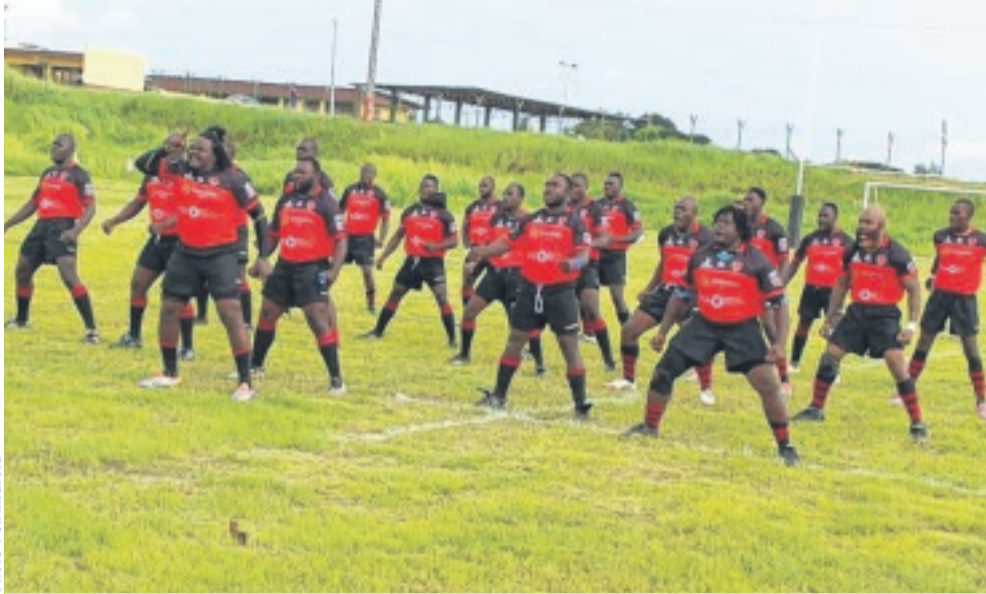
Le Rugby club de Libreville reste leader du championnat.