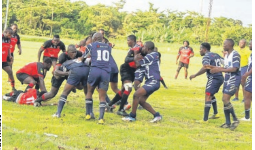
Phase de jeu entre le RCL (en rouge) et les Vautours XV (en bleu).