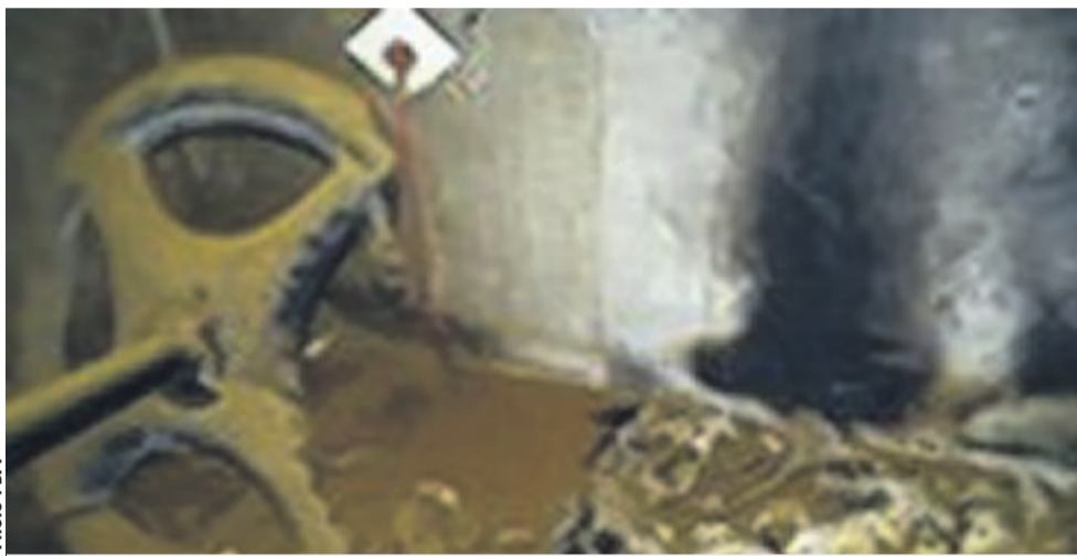
La scène du drame.

Malheureusement, en quittant la maison où elle laisse ses deux enfants endormis, la mère de famille oublie de débrancher le chauffe-eau et, surtout, le pose malencontreusement sur le bord du matelas