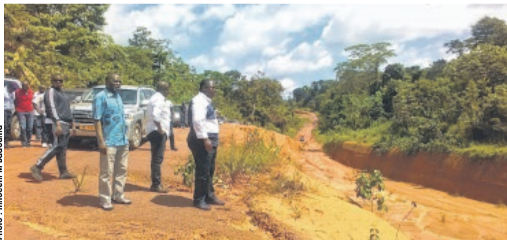
Les membres du gouvernement sur une partie de la route complètement dégradée.