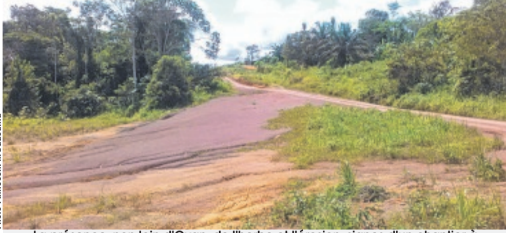
La présence, non loin d'Ovan, de l'herbe et l'érosion, signes d'un chantier à l'abandon.

En visite, lundi dernier, sur cette voie très dégradée, le chef du gouvernement a fait état du volume de financement et du mode approprié de mobilisation de fonds, de l'aménagement et du bitumage de ce qu'il a appelé la Route de l'Est.