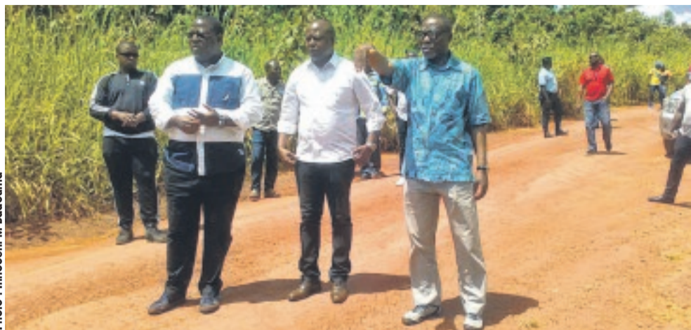
Le ministre Nelson Messone expliquant la dangerosité de la descente de Tsengkellé (PK 50)