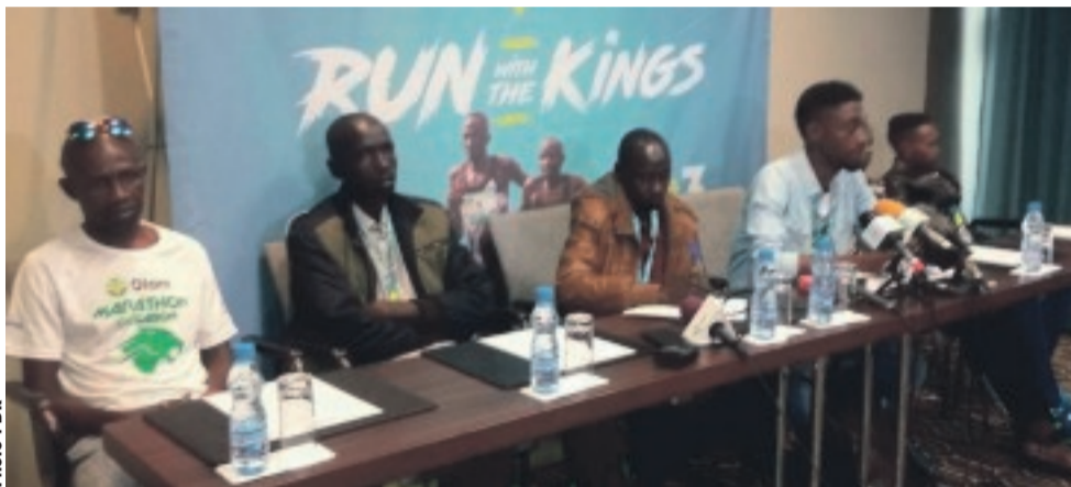
Vue partielle des athlètes et des organisateurs de la conférence de presse.