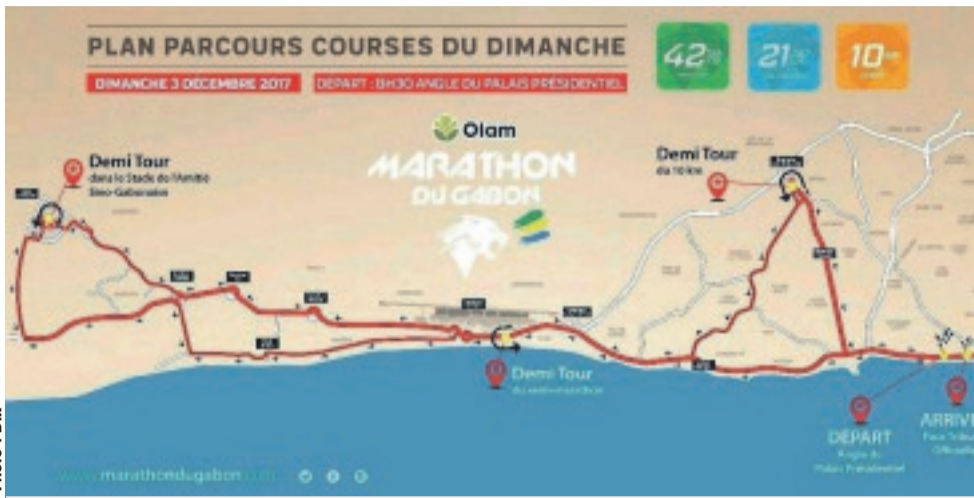
Le plan du parcours de la course de dimanche

Classé troisième au semi-marathon lors de l'édition précédente, le Gabonais Serge Ikapi, qui se veut être un conseiller et tête de