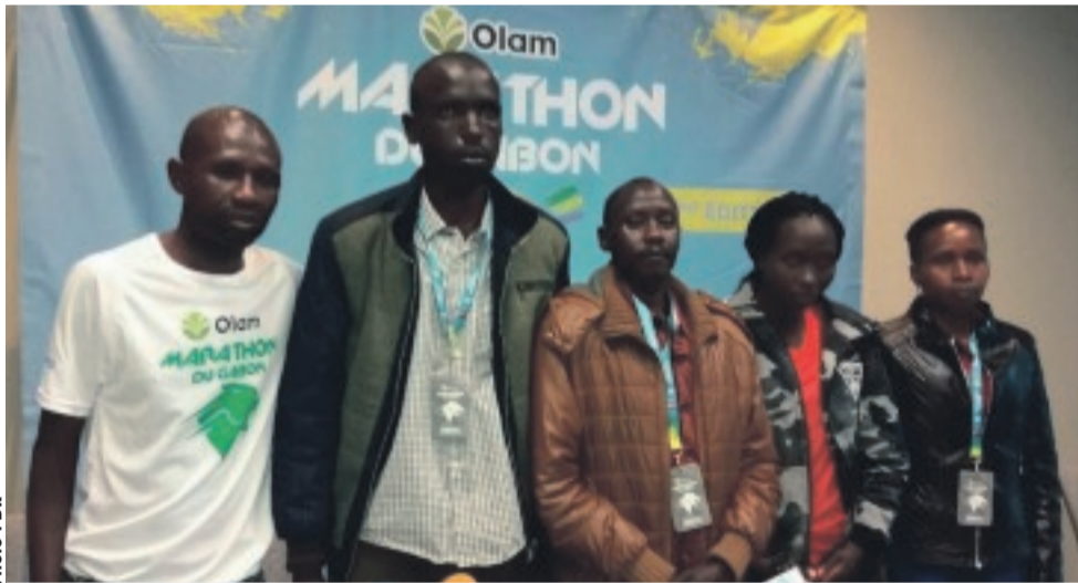
Quelques athlètes qui participent au meeting de Libreville.