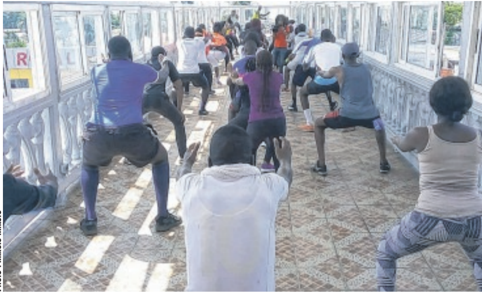
Une séance de relaxation.