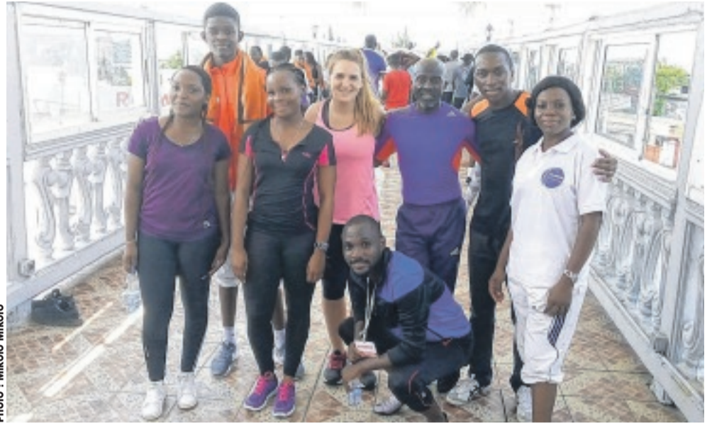
Quelques athlètes posent pour la postérité avec Me "Wapi" et l'experte du CNOG.