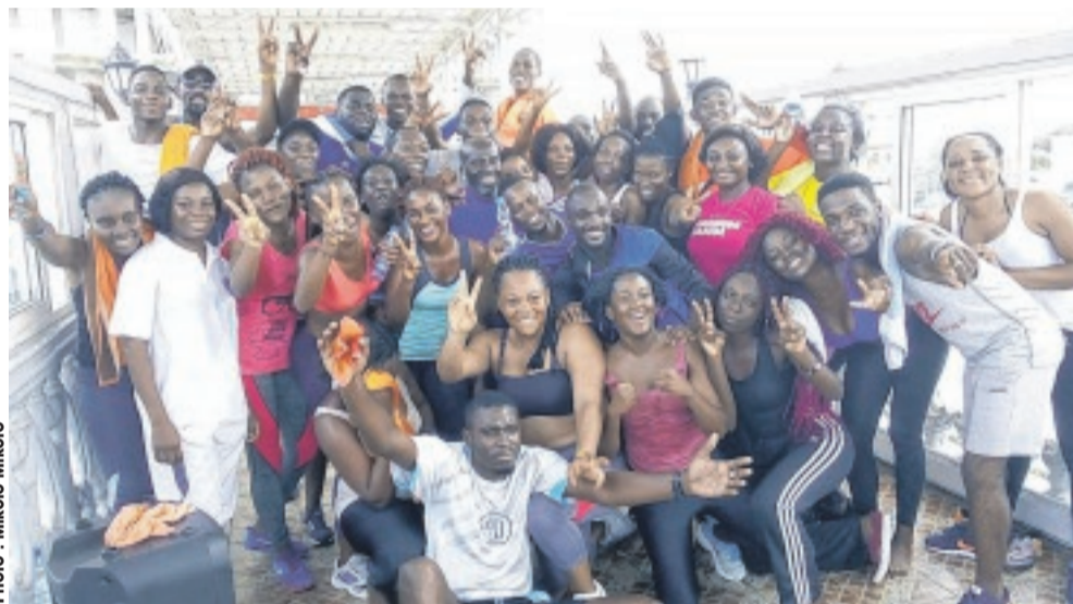
Encadrement techniques et participants à l'issue de la manifestation sportive.

La journée "Fresh fitness", organisée par le club olympique EMG (École de management du Gabon), a