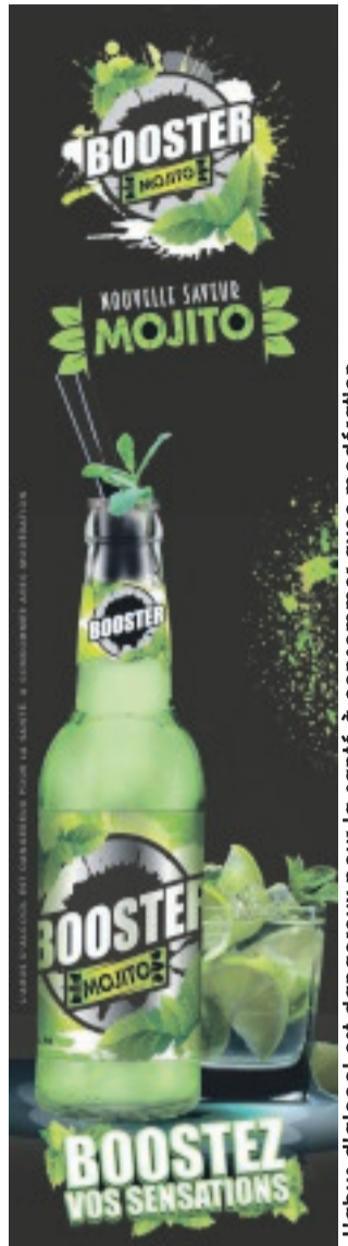
L'abus d'alcool est dangereux pour la santé à consommer avec modération