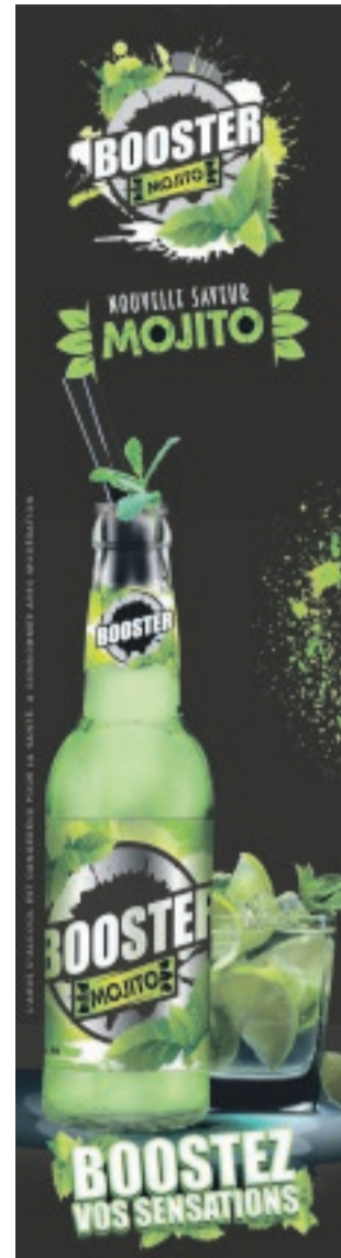
L'abus d'alcool est dangereux pour la santé à consommer avec modération