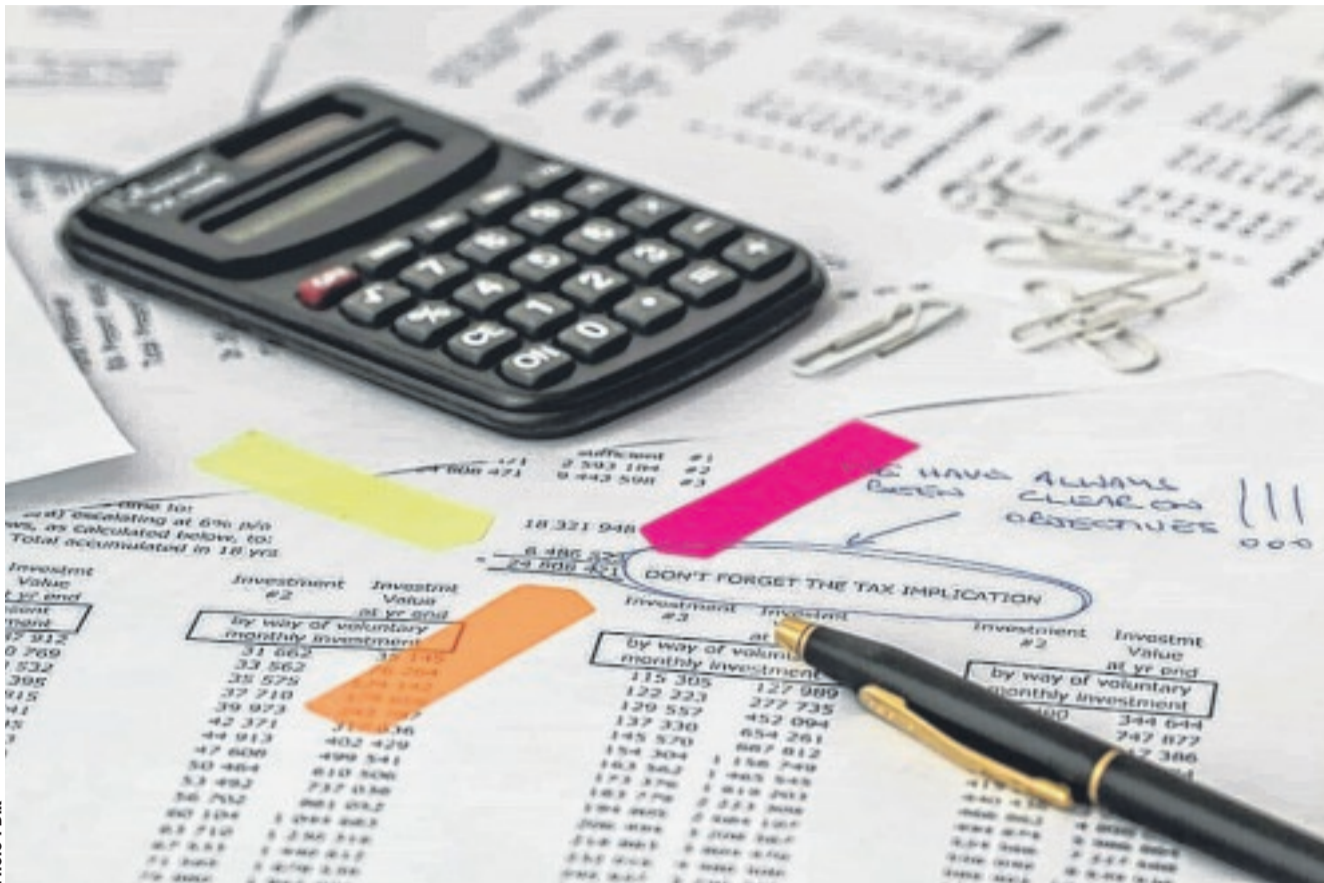
Les instruments du professionnel de la vérification des comptes.

PROFESSIONNEL OBJECTIF ET IMPARTIAL* Aussi, leur faut-il ce pro-