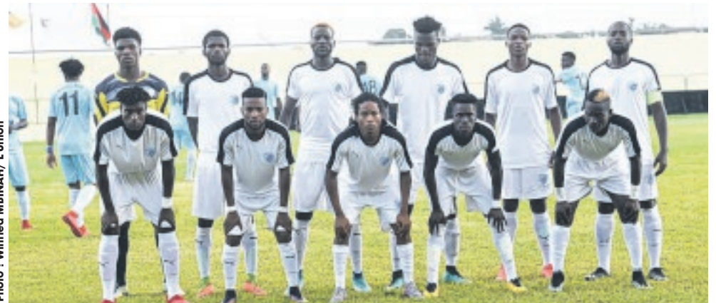
... le club de Silver Strickers de Malawi ?