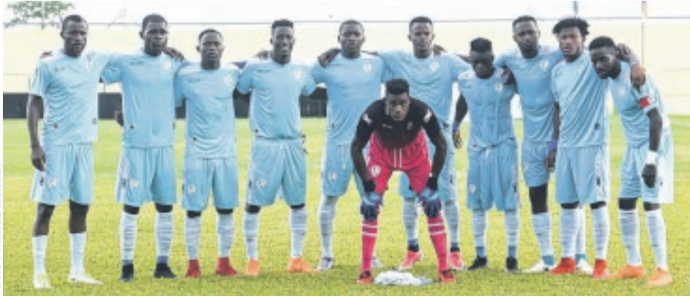
La formation de l'AO CMS peut-elle laisser définitivement en rade...