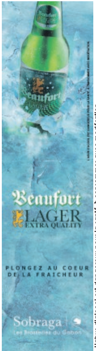
L'abus d'alcool est dangereux pour la santé à consommer avec modération