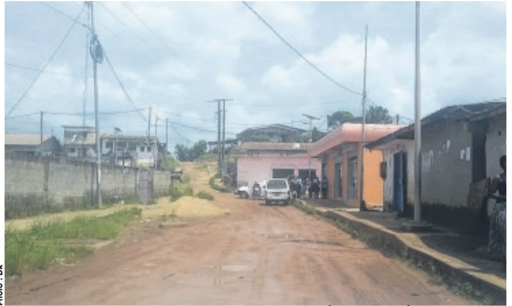
... atteindre cette autre voie, en mauvais état pour espérer emprunter une occasion.