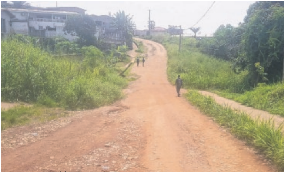
Les élèves du lycée public de Diba-Diba doivent parcourir près d'un kilomètre pour...