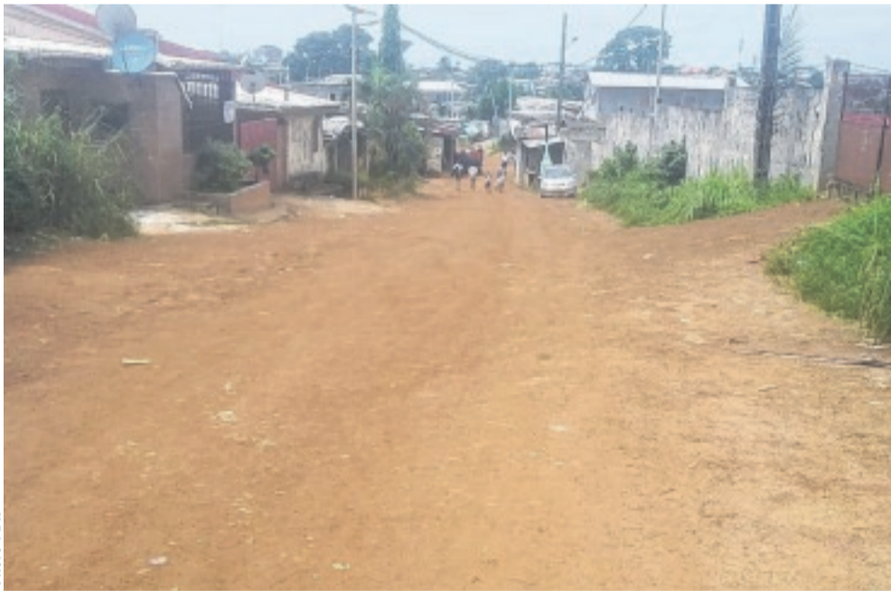
Où sont passés les engins de Colas ? Ici, une voie menant à l'ENS.