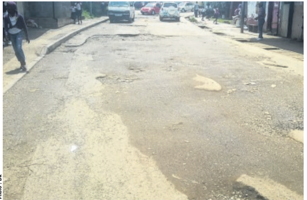
Une route dans un autre quartier du premier arrondissement de Libreville.