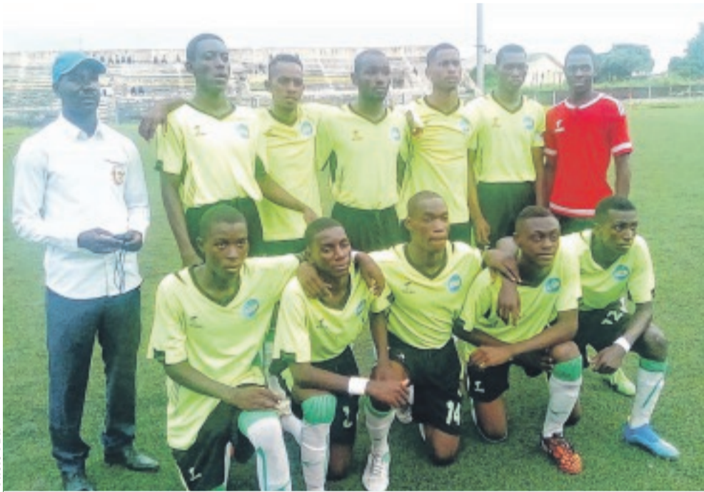
L'équipe de Terre de foot a eu raison de...