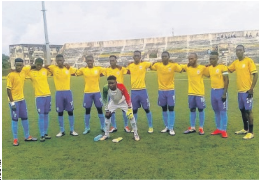
... la formation de Stade Mandji, en finale du tournoi de mise en jambes.