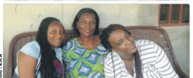
Le défi convie aussi les familles et va parfois au-delà des 10 ans demandés sur la toile.

actuelle. Ensuite, les internautes ont décidé de publier des photos d'eux d'il y a 10 ans (en 2009) à côté d'une image récente les concernant et datant de 2019. Le défi semble porter donc plusieurs noms : 2009 contre 2019, 10 years challenge ou défi de 10 ans. Puis, comme vous l'avez constaté, les médias sociaux ont tous été inondés. D'autres, à défaut de 2009-2019, postent des photos de 2008-2018. Certains ont exagéré en publiant des photos datant de 20 ans ou plus ou encore moins."