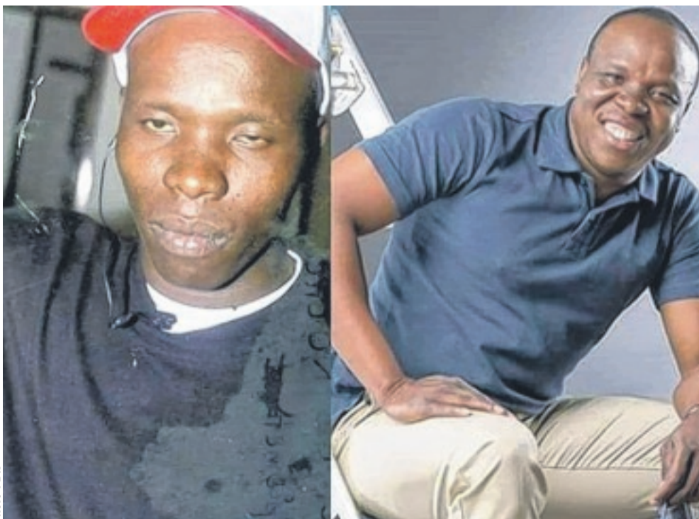
A'salfo du groupe, Magic System 10 ans d'intervalle.

A titre de rappel, le challenge se poursuit. Et si vous sautiez le pas en livrant deux montages photos de vous de 10 ans d'intervalle ?