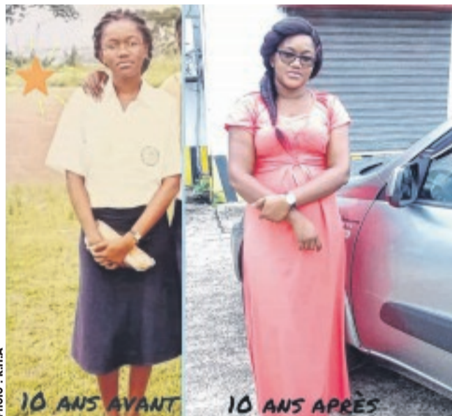
10 années séparent ces 2 photos représentant une même personne.

La consigne est stricte : après avoir collé les deux images, celles-ci doivent être postées sur les réseaux sociaux. Il s'agit maintenant de laisser des amis faire des commentaires en comparant les évolu-