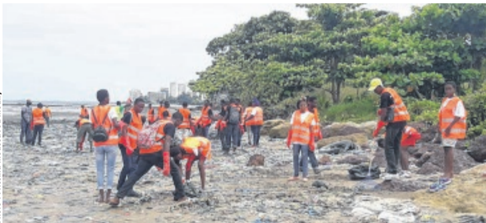
Plusieurs bénévoles étaient déployés sur les sites de Michèle Marine...