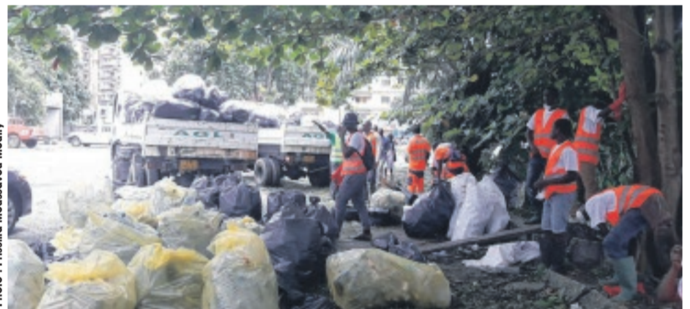
...et du bord de mer (en face de la CNSS), dans le cadre d'une opération de ramassage d'ordures...