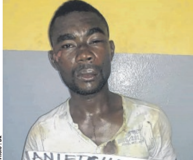
... Miyenikoué méditent sur leur sort...