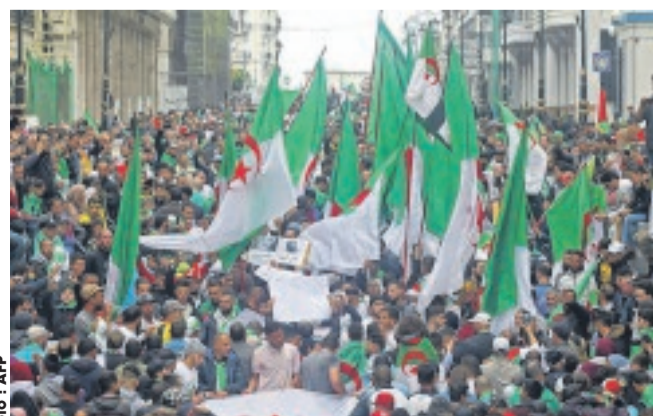
Encore très nombreux hier, les manifestants n'entendent décidément rien lâcher, malgré la perspective du ramadan.

Un mois de jeûne et de privation, durant lequel les Algériens se couchent souvent tard et au fur et à mesure duquel la fatigue se fait de plus en plus sentir. Pour pallier la fatigue, la faim et la soif de la journée, la plupart des manifestants proposent de déplacer pendant le ramadan les marches le soir, après le "ftor", la rupture du jeûne.