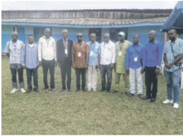
Les membres de la coalition des syndicats des transporteurs réunis en assemblée générale samedi dernier.