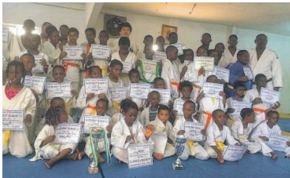
Photo de famille de fin de saison marquée par le passage de grades au Judo Club Académie de Libreville.